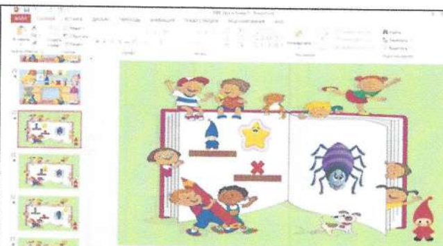
Рисунок 3. Игра «Поймай звук»