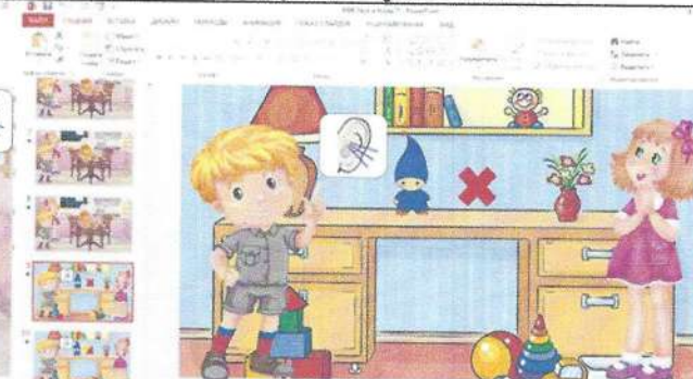
Рисунок 2. Игра «Поймай звук».