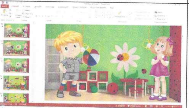
Рисунок 4. Игра «Скажи наоборот»