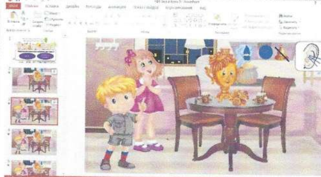
Рисунок 1. Упражнения по формированию акустико-артикуляционного образа звука.